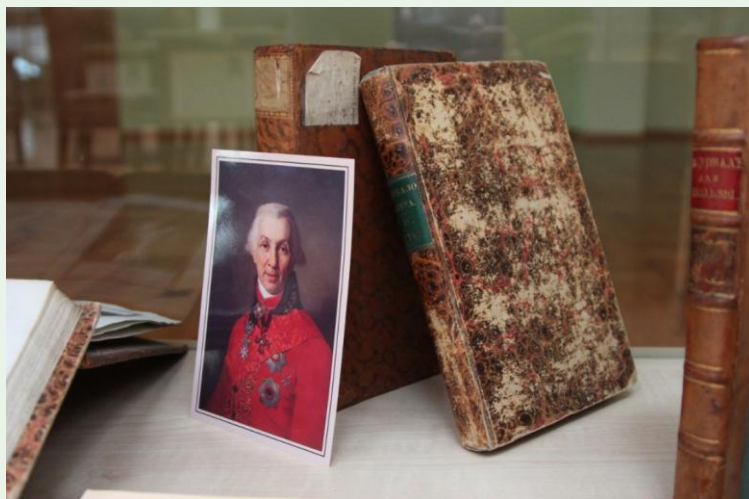
Коллекция Г. Р. Державина в Тамбовской областной универсальной научной библиотеке им. А. С. Пушкина