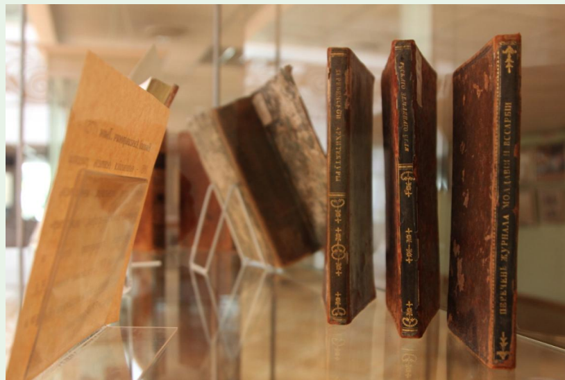
Коллекция периодических изданий Г. Р. Державина в Тамбовской областной универсальной научной библиотеке им. А. С Пушкина

след в развитии отечественной журналистики: «Древняя российская вивлиофика ...» — первое крупное издание