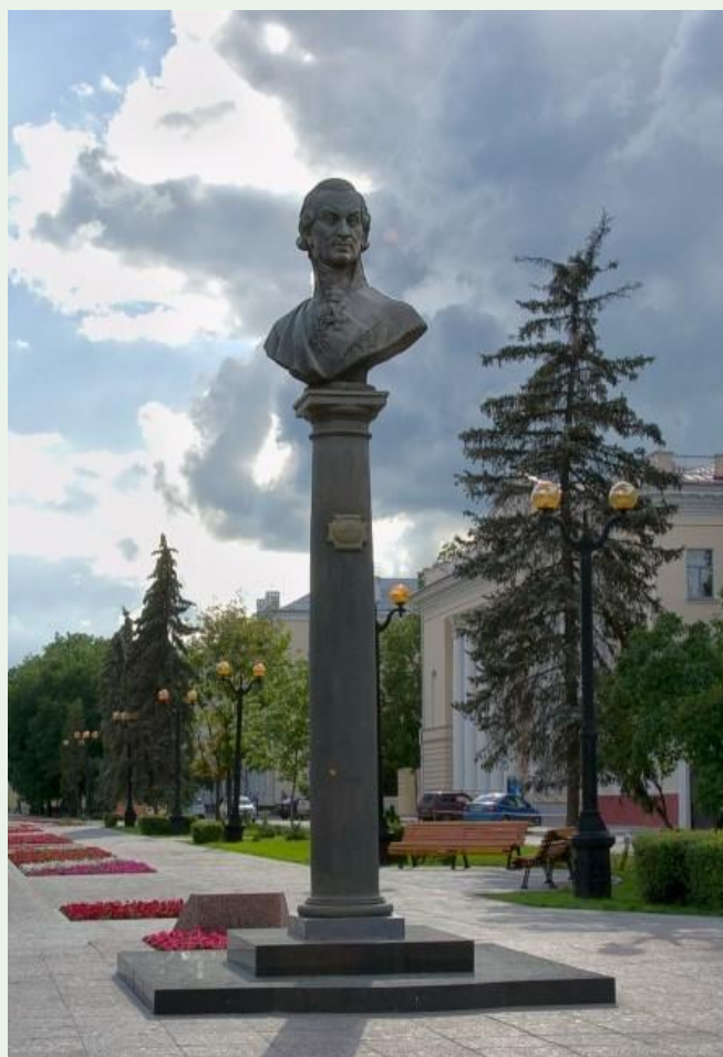
Памятник Г. Р. Державину в Тамбове. Скульптор К. Я Малофеев.

Державин Гавриил Романович умер 20 июля 1816 года в Званке и был похоронен в Петербурге. Имя Державина в Тамбове носят государственный университет, гимназия, улица, на которой в 1994 году установлен памятник поэту.