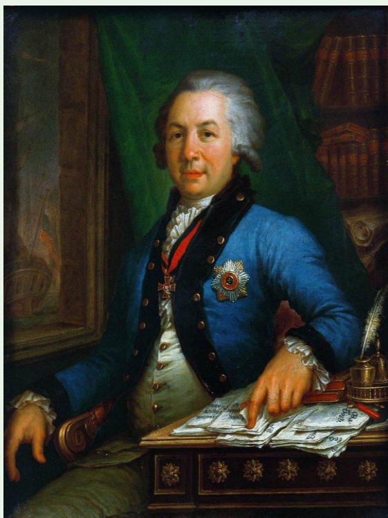
Г. Р. Державин Портрет работы В. Л. Боровиковского

(14 (3) июля 1743 — 20 (8) июля 1816), великого русского поэта, общественно-политического деятеля